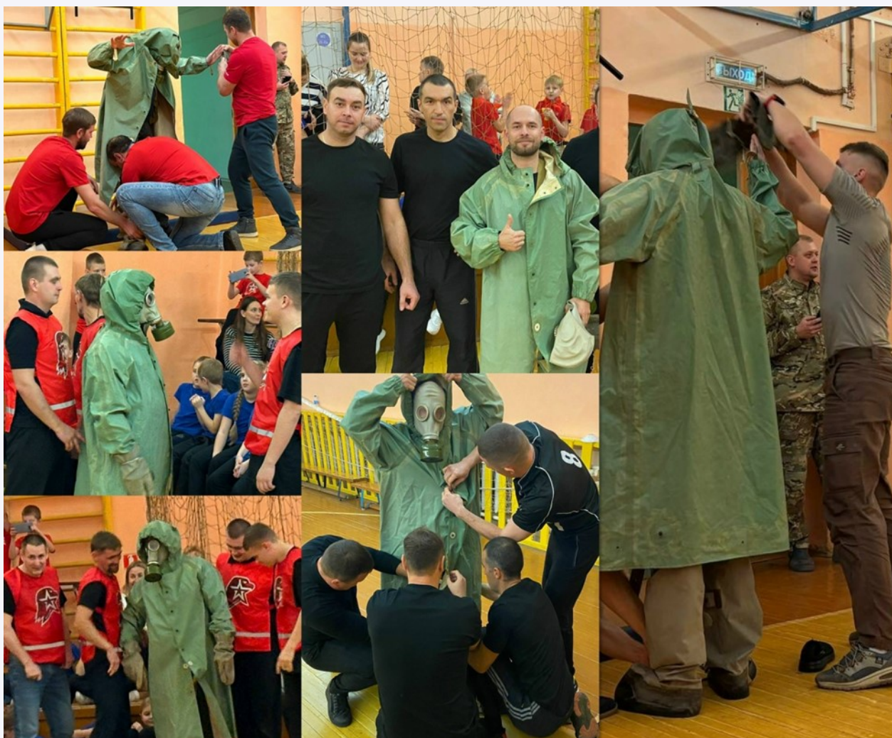
Соревнования «Отец юнармейца!»